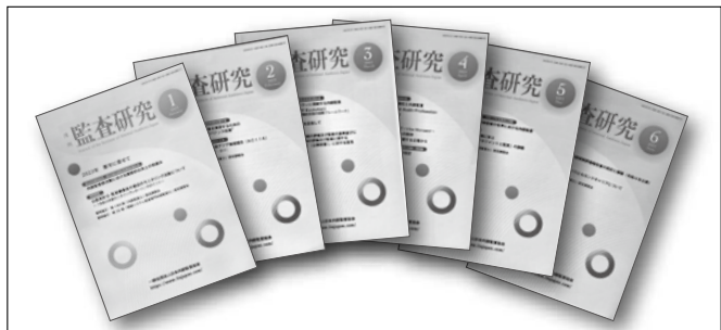
〈協会機関誌〉『月刊監査研究』（月1回発行）